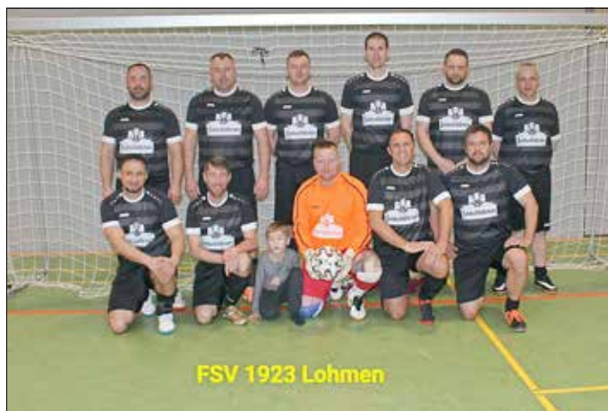
FSV 1923 Lohmen